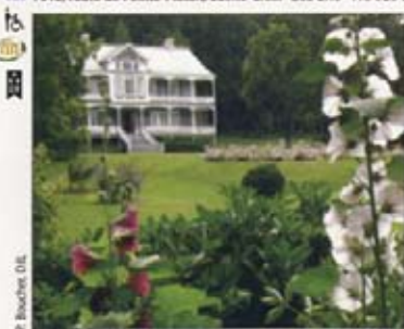
J. Beauches, D.L.

7015, route de Pointe-Platon, Sainte-Croix G0S 2H0 418 926-2462 www.domainejoly.com