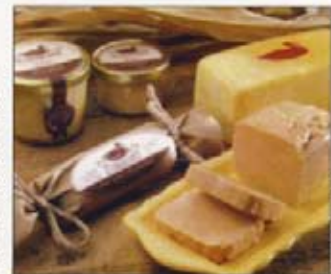
Le Canard Goulu, Saint-Apollinaire

Le Canard Goulu, chef de file dans la production de canard de Barbarie au Québec, vous invite sur sa ferme ancestrale. À la boutique, joliment aménagée dans un vieux poulailler, plusieurs choix s'offrent à vous : soit que vous vous gâtiez avec des produits simples, sains et savoureux tels que rillettes, confit, magret ou foie gras, soit que vous profitiez plus longuement de votre visite en dégustant, sur notre terrasse fleurie, certains produits nobles du canard. Mieux encore, avec famille et enfants, vivez un moment paisible et charmant en vous baladant sur « La petite ferme de Jérôme » où vous pouvez également pique-niquer. Ouverte en saison estivale, la petite ferme compte, bien sûr, des canards, mais aussi de nombreuses espèces d'animaux qui évoluent dans un environnement naturel. Vous quitterez le Canard Goulu le corps et l'esprit bien nourris. Horaires : boutique : du lundi au dimanche, de 10 h à 17 h. Dégustations : du mercredi au dimanche, de 11 h à 16 h 30. Entrée : libre.