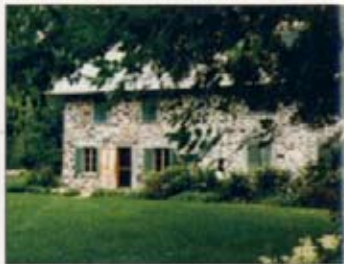
Moulin du Portage

À l'ouest du village de Lotbinière, découvrez ce bijou, datant de 1816, caché en plein cœur de la nature. Construit sur une presqu'île ceinturée par la rivière du Chêne coulant au pied de majestueuses falaises, cet ancien moulin à farine seigneurial vous invite à rencontrer les familles de meuniers qui y ont vécu, les « habitants » dans leurs activités quotidiennes grâce à une visite commentée et aux photos d'archives exposées au grenier. Vous pouvez aussi pique-niquer sur la terrasse, vous promener au bord de la rivière ou voir un artiste de renom présenter son spectacle en toute intimité dans notre salle au cachet unique. Nouveau en 2009 : sentier pédestre de 4,2 km (niveau intermédiaire) longeant la rivière jusqu'au joli village de Leclercville. Horaires : accès gratuit au site, à l'année. Visites commentées, de la fin juin à la mi-août ou sur réservation. Entrée : libre.