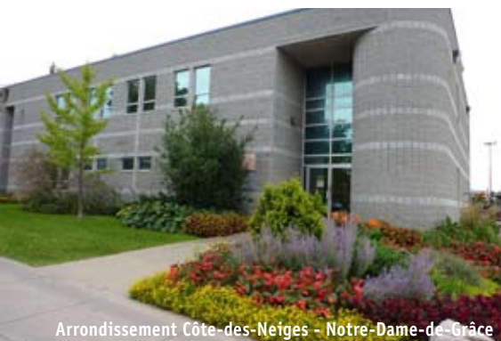
Arrondissement Côte-des-Neiges - Notre-Dame-de-Grâce

Les membres du comité d'embellissement ont débuté la réintroduction dans les aménagements publics des végétaux indigènes et ornementaux du début de la colonie. Une trame historique sera ainsi créée avec le temps. (Atelier vert de Témiscouata-sur-le-Lac)