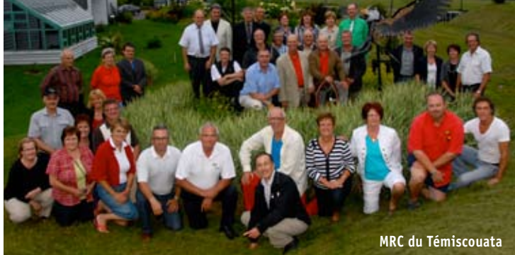
MRC du Témiscouata