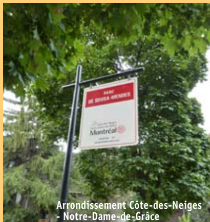
Arrondissement Côte-des-Neiges - Notre-Dame-de-Grâce